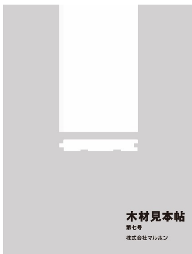
▲木材見本帖第七号表紙